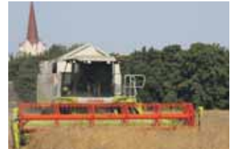
Teraviljakasvatavad jäävad tänavuse saagiga rahule

Üksikasjalikumad nõuanded asuvad veebilehel www.kodutuleohutuks.ee