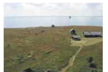
Surnuaiapäeva Rammu saarel