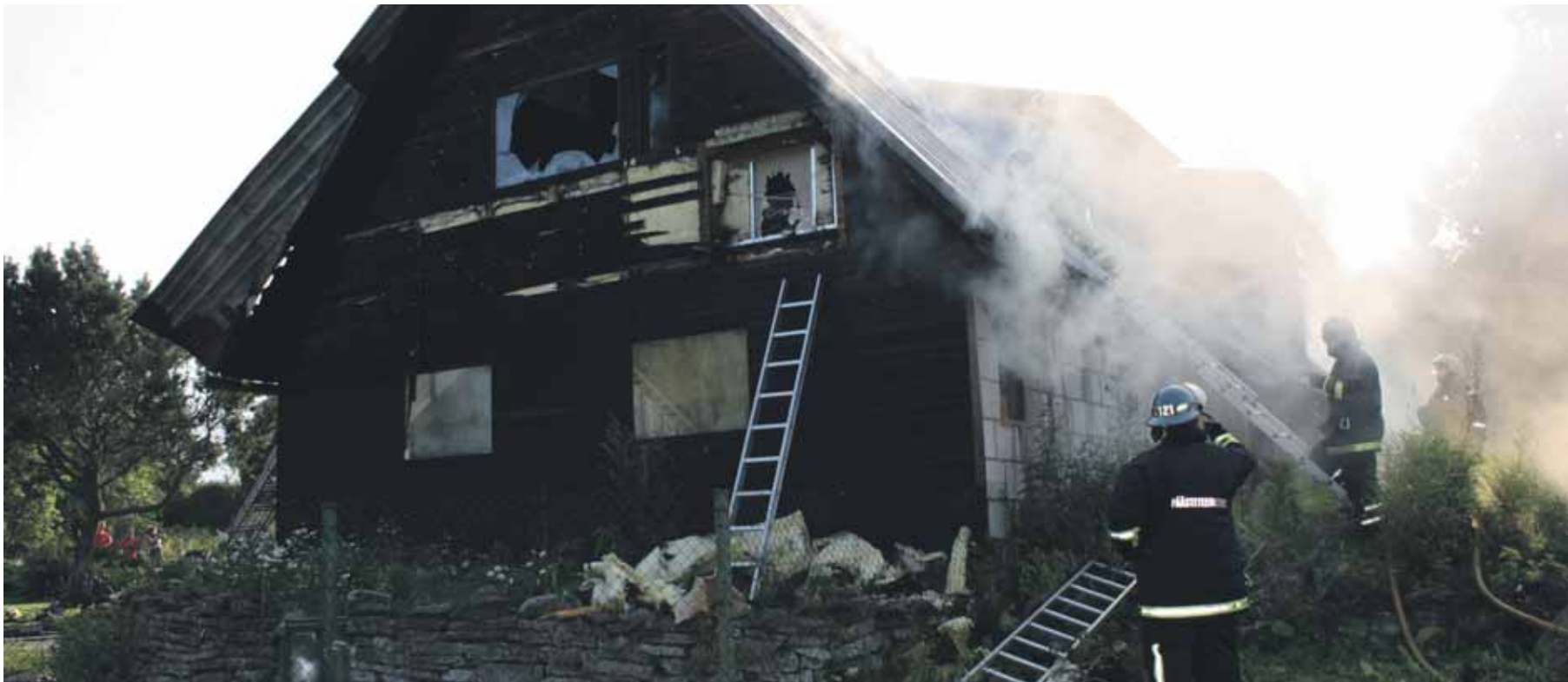
Kallavere küla Rätsepa talu elamu on tänaseks maha lammutatud.