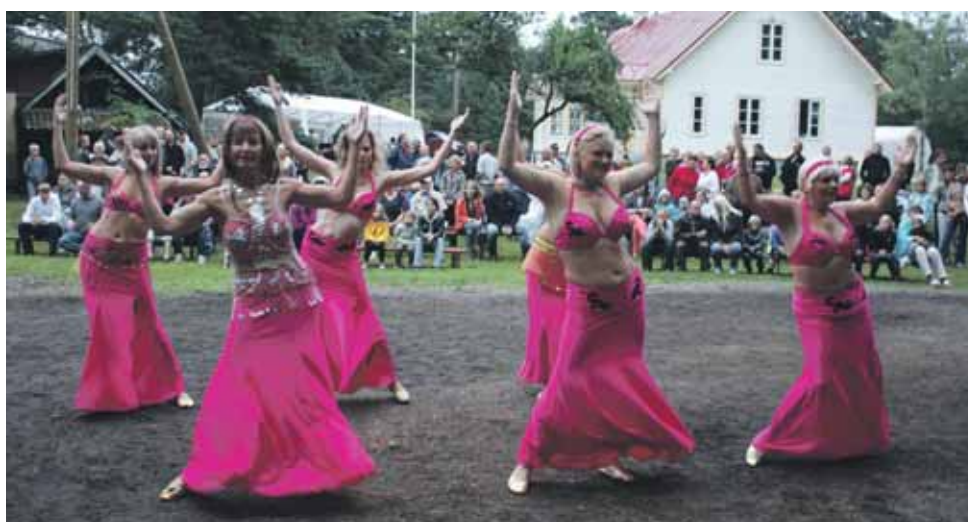
Üllatusesineja oli tantsurüpp Sayyida.