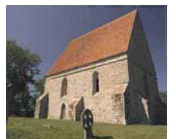
Saha kabeli katus sai enne äikesetormi korda